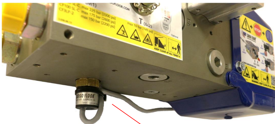
Temperatuur schakelaar in T3A

Schroef de compleet samengestelde temperatuurschakelaar met de hand zover mogelijk in de opening T3A van het besturingsventiel. Zet vervolgens met een steeksleutel 27 mm de temperatuurschakelaar vast op max. 22 Nm.